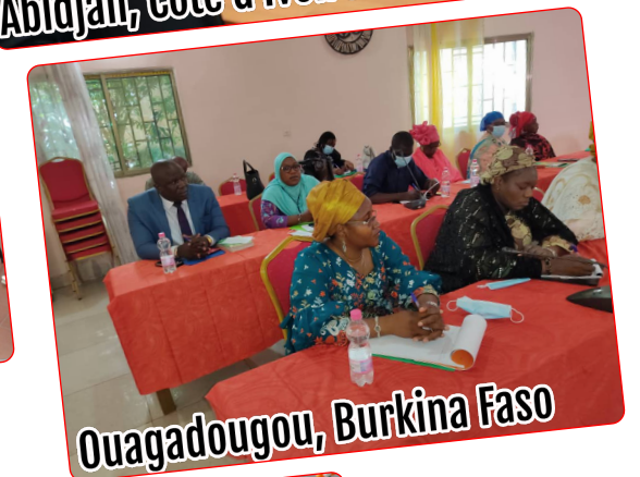
Ouagadougou, Burkina Faso