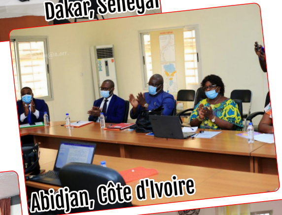
Abidjan, Côte d'Ivoire