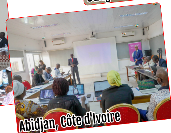
Abidjan, Côte d'Ivoire